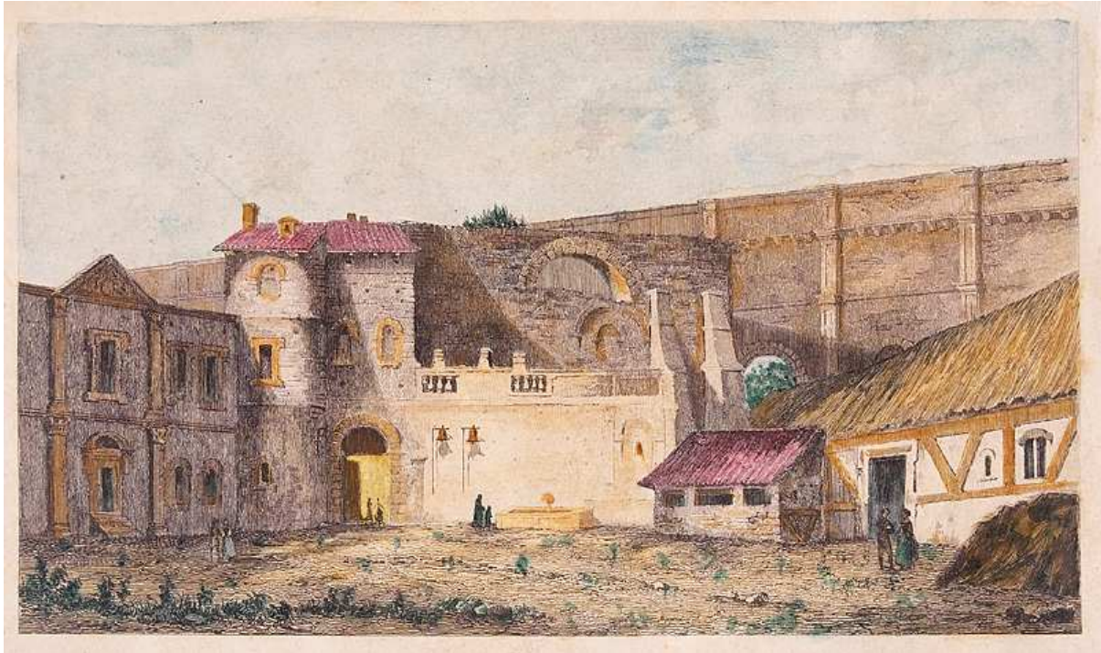
Image 2 - Les restes de l'aqueduc romain dans la cité-jardin d'Arcueil