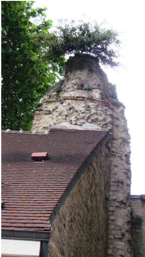
Image 3 - Une arche et trois piles de l'aqueduc romain ont été restaurées au-dessus du conservatoire de musique de Cachan